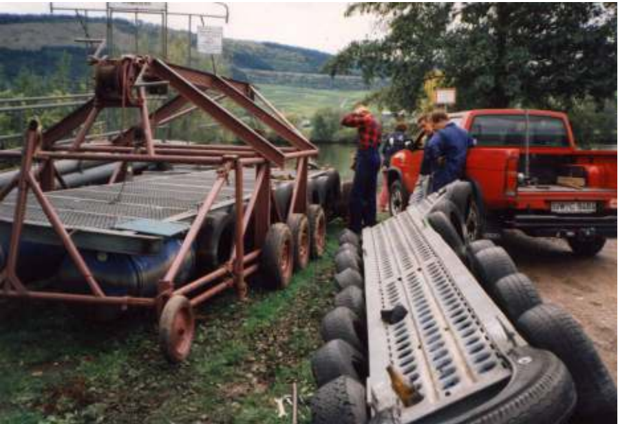
wie nemmern denn (wie lassen wir den Steg diesmal ins Wasser)