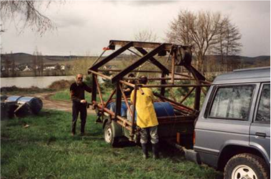
Ankunft des Kranwagens