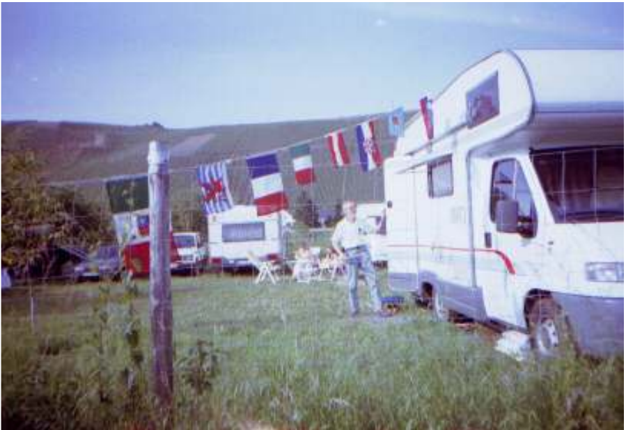
„Flaggenparade“ des Präsidenten