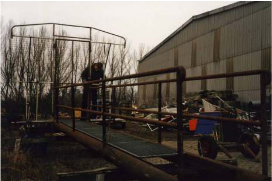
Umbau der alten Steganlage